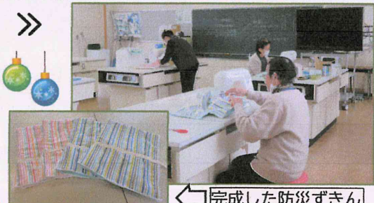
完成した防災ずきん

11月9日(木)16日(木)30日(木)に、今年も立仏小学校家庭科室に於いて、「防災ずきんを学校で作ってみませんか!!」として、保護者・地域の方々と一緒に楽しくおしゃべりしながら防災ずきんを作りました。ひとりで作るには不安な方や、ミシンをお持ちでない方も学校で作ることによって、ご協力していただくことができました。おかげさまで、新1年生の防災ずきんが完成しました。